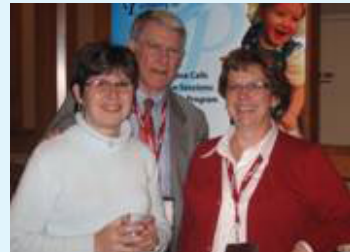
Participants à l'activité de formation